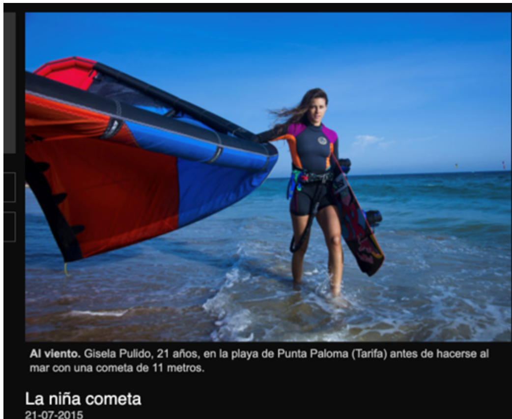
La niña cometa