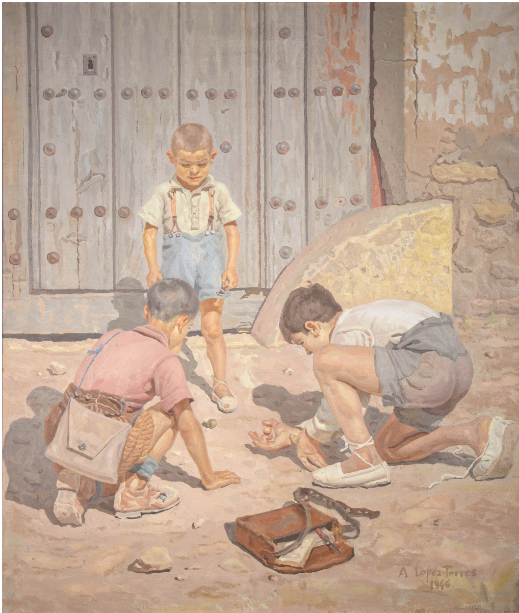
Des enfants en train de jouer aux boules